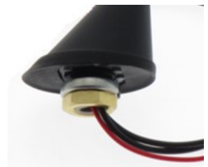
(b) Kabeldurchführung zentral