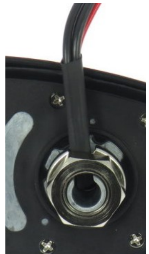
(a) Kabeldurchführung seitlich

Montieren Sie die Antenne indem sie die Mutter mit den Zähnen gegen die Metallfläche aufdrehen. Achten sie dabei darauf, dass die Mutter nicht verkantet und das Gewinde beschädigt wird. Sie können die Kabel seitlich (a) in der vorgesehenen Öffnung ausführen oder zentral (b) durch die Mutter ausführen. Achten sie jeweils darauf, dass die Kabel nicht gequetscht werden.